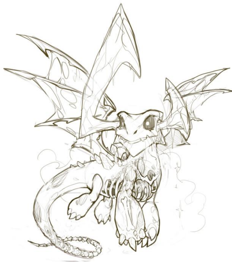
五级 动漫形象再创作