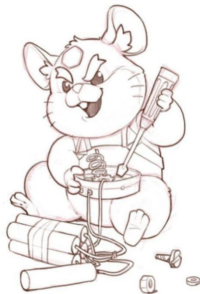
二级 动漫形象临摹