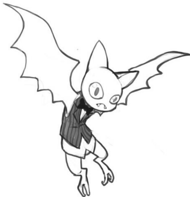
一级 动漫形象临摹