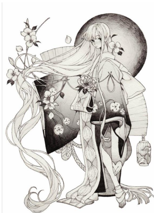
四级 动漫形象命题创作，加简单场景