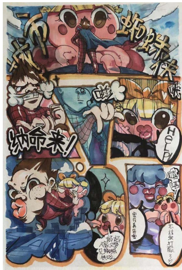
七级 4-6 格漫画